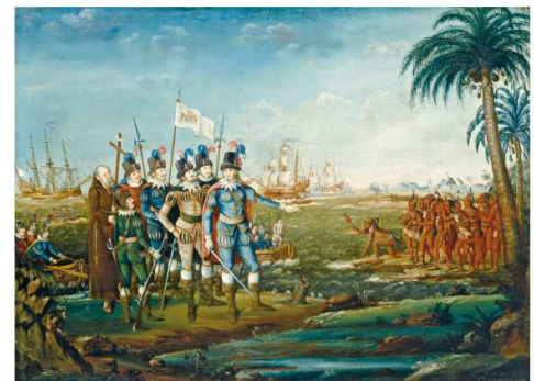
Desembarque de Cristóvão Colombo na ilha de São Salvador, obra de Frederick Kemmelmeyer, 1805. Óleo sobre tela (70 cm x 92,5 cm). NATIONAL GALLERY OF ART, WASHINGTON DC.

Em 12 de outubro de 1492, Cristóvão Colombo desembarcou em uma ilha, à qual deu o nome de São Salvador. Essa ilha era apenas uma pequena parte do continente que mais tarde passaria a se chamar América ou “terra de Américo”, em homenagem a Américo Vespúcio, banqueiro, navegador e um dos financiadores das primeiras expedições ao chamado Novo Continente.